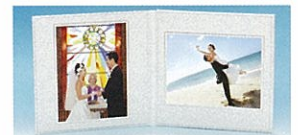
見開き台紙付アルバム(イメージ)

Aプラン、Bプラン共通案内 *プラン料金は日本でのお支払いとなります。その他追加オプションはすべて現地でのお支払いとなります。 *お打合せ、試着は全てハワイとなります。日本で承ることはできません。 *お申込みは15日前までお願いいたします。 *送迎につきましては、PUC(州政府より認可された車両)を使用いたします。(専任ドライバー付、リムジンではございません。) *ヘアメイク・着付けは各衣裳会社サロン内にて行います。(約1時間) *撮影データは撮影日の翌々日宿泊ホテル(ワイキキ)へお届けいたします。お客様の都合によりお受け取りできない場合は日本へ発送いたしますが、送料はお客様ご負担とさせていただきます。 *写真撮影の場所、撮影内容はカメラマンの裁量となります。 *天候などの事情によりビーチでの撮影ができない場合は、他の場所(ワイキキ)に振り替えさせていただきます。 *ご同行者の参加はお断りしております。カップルのお子様についてはご相談下さい。