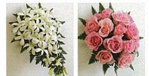
生花のブーケ(イメージ) デンドロビュームのクレセント ピンクローズラウンド